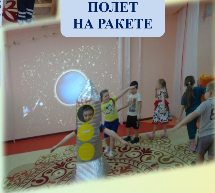
ПОЛЕТ НА РАКЕТЕ