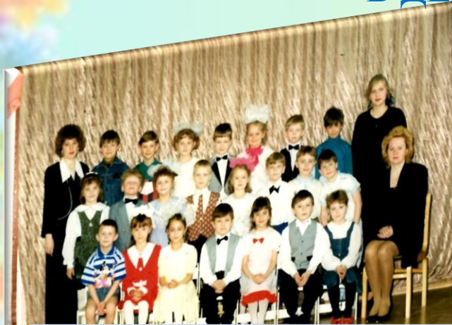
МОЙ ВЫПУСК В САДУ 1997