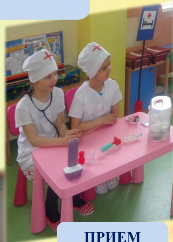
ПРИЕМ У ВРАЧА