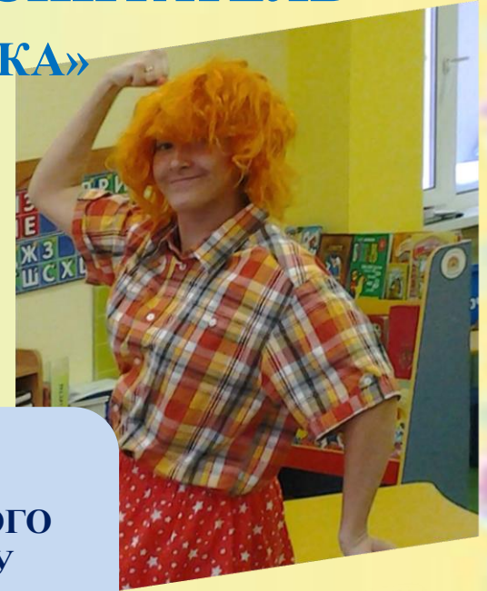
РОЛЬ УПИТАННОГО И В МЕРУ ВОСПИТАННОГО